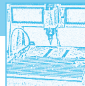
TABLE DE SOUDAGE FIXE TSF 02 pour le soudage de goujons par :