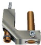
Adaptation mandrin déporté